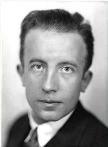
Éluard circa 1930